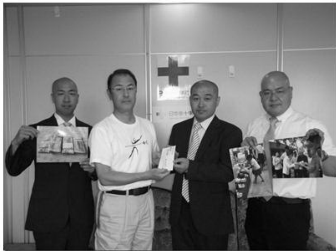
「日本赤十字社 宮城県支部」へ