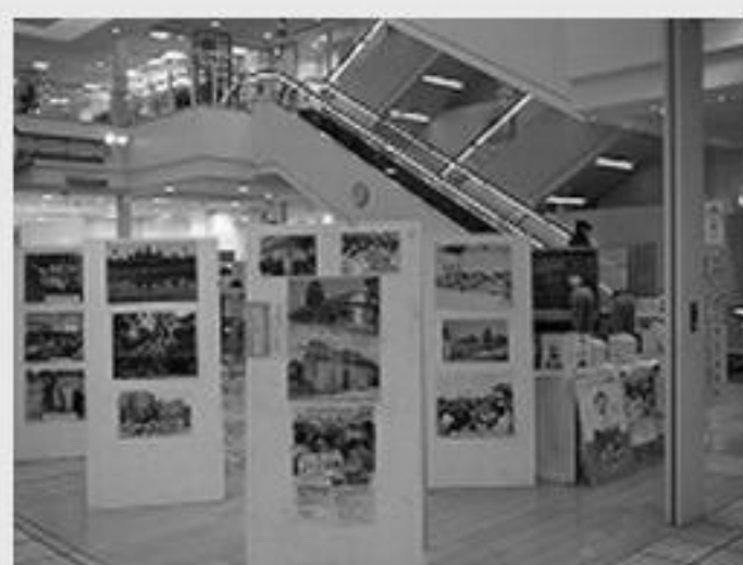
昨年のカンボジアフェアの様子

開催日程：平成23年12月15日(木)～16日(金) 於：仙台市泉区泉中央 SELVA 2Fセンターコート特設会場 内容：東日本大震災に対するカンボジアからの支援の紹介 カンボジアの子供たちとの交流活動の紹介